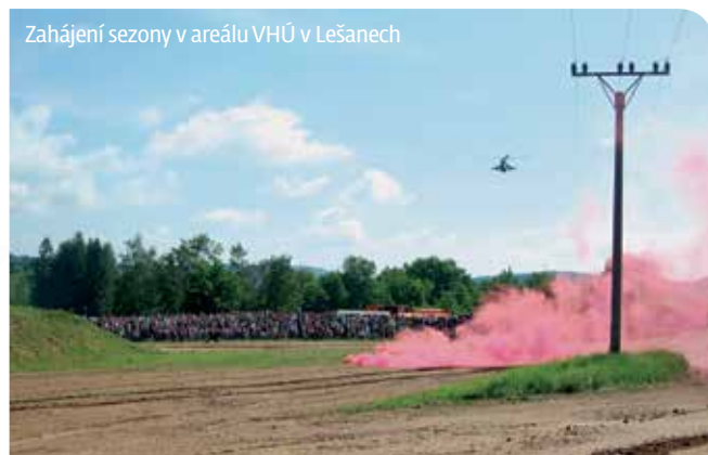
Zahájení sezony v areálu VHÚ v Lešanech